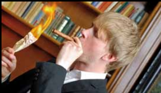
What your friends think they do