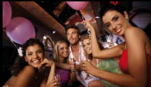
What society thinks they do