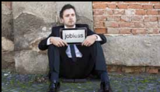
What your parents think they do